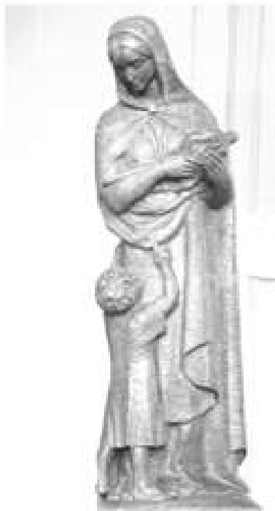
Notre Dame du Travail